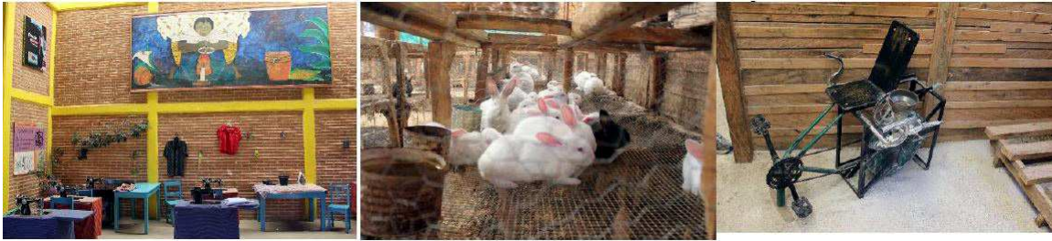
यूनिटिएरा का सिलाई घर, पशु पालन घर और मक्का पीसने की मशीन